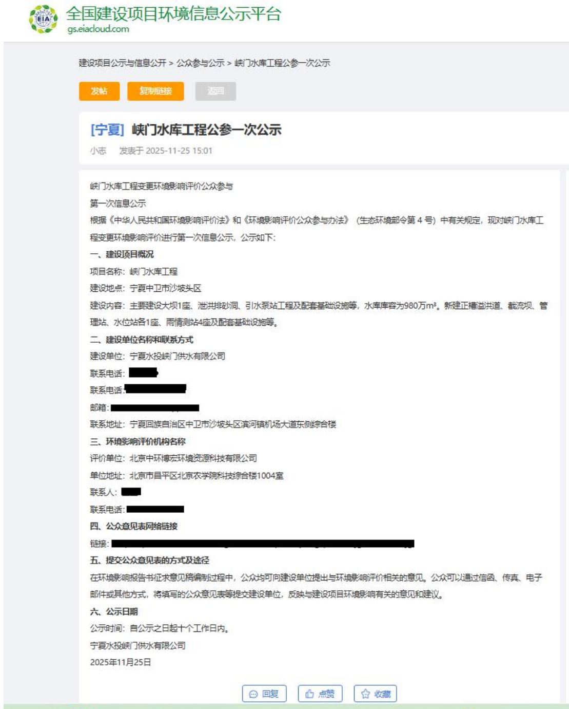
图 2.2-1 第一次公示网站截图

(2018 年部令第 4 号) 的要求, 本项目在委托环评后在全国建设项目环境信息公示平台进行了网络平台公示, 网络公示见图 2.2-1。