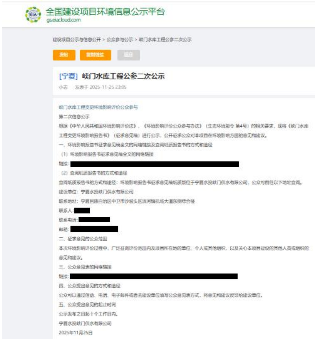
图 3.2-1 征求意见稿网络公示截图（全国项目环境信息公示平台）