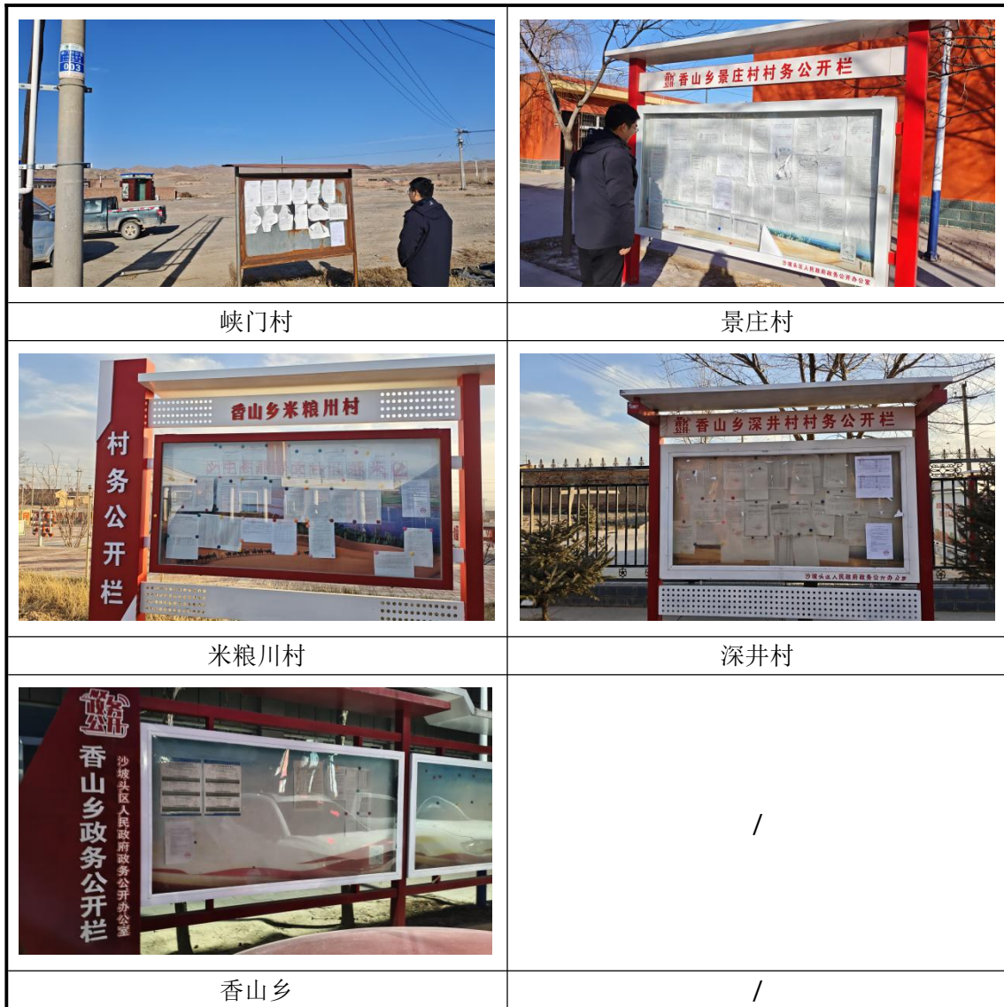
图 3.2-2 征求意见稿现场公示照片