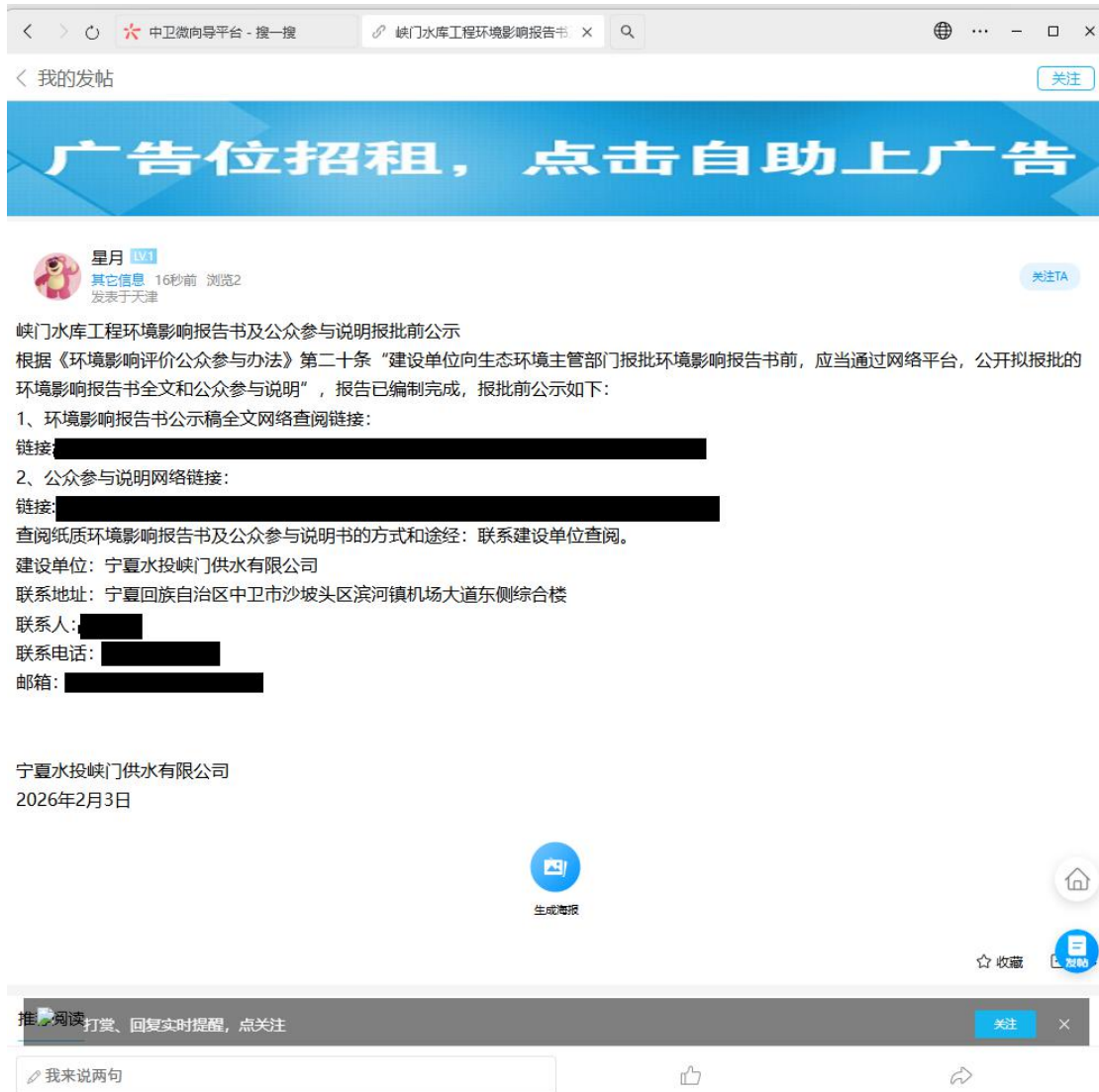
图 5.1-3 2026 年 2 月 3 日补充公示截图