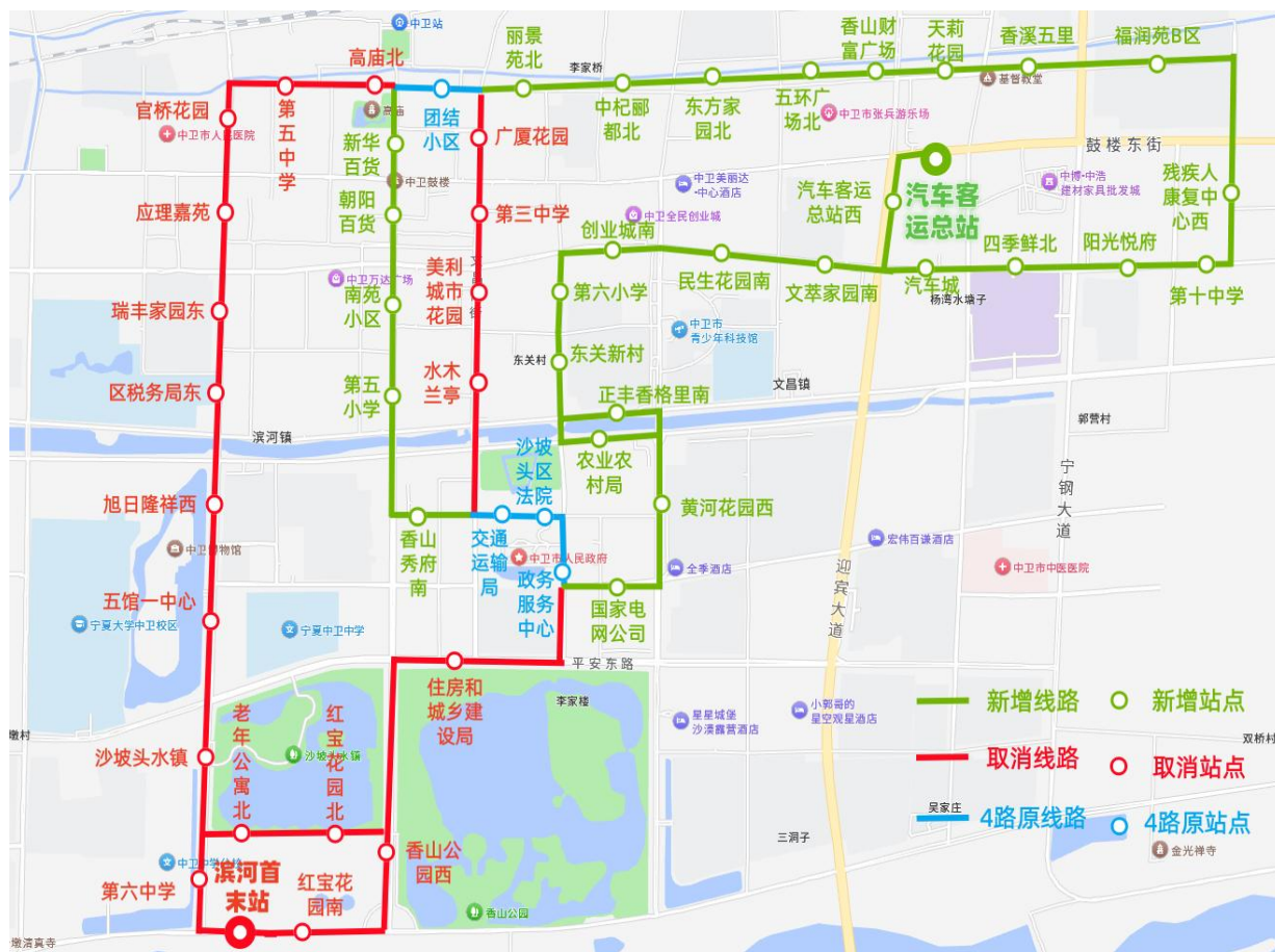
图2 4路公交优化前后运行图

公里)，均可通过4路公交直达校区，切实提升了沿线居民学生公共交通出行的便捷性。（见图2）