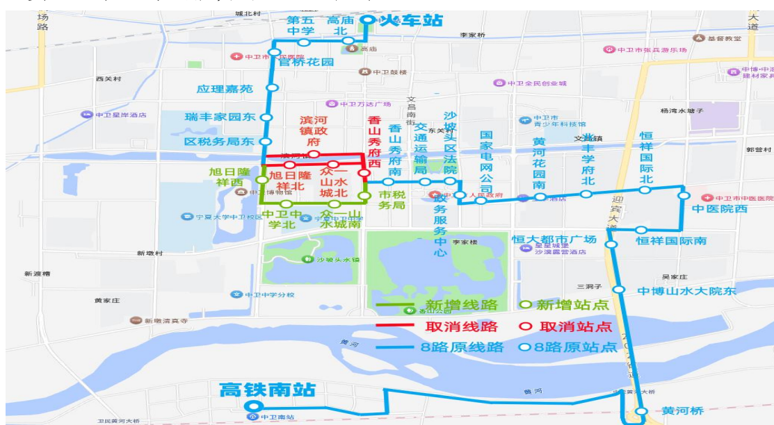
图 6 8 路公交优化前后运行图

优化后线路主要经过迎宾大道、丰安东路、鸣沙路、丰安西路、应理街至火车站，串联黄河花园、众一山水城、旭日隆祥、应理嘉苑、瑞丰家园、政务服务中心、中卫中学等主要小区、交通枢纽和公共服务设施（见图 6）。