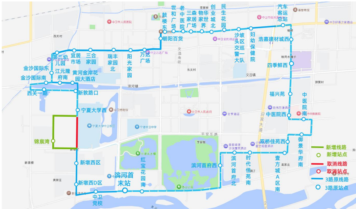
图 1 3 路公交优化前后运行图