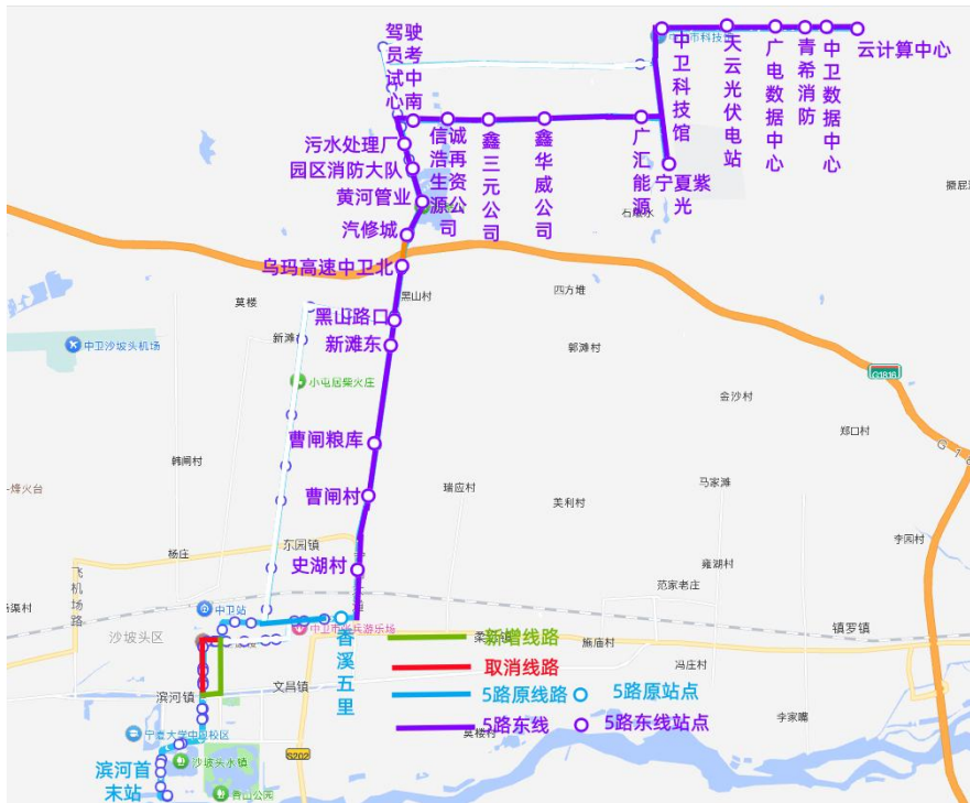
图 4 5 路东线工业园区运行图