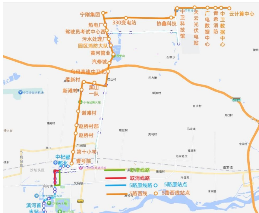
图 5 5 路西线工业园区运行图